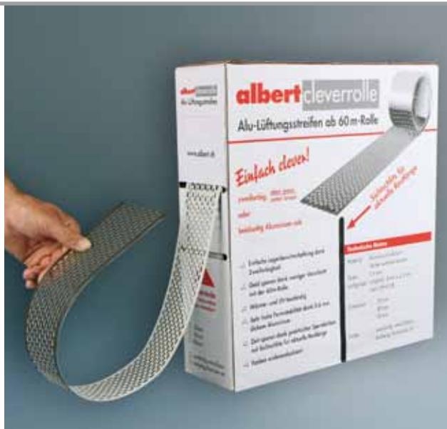
albert cleverrolle avec deux couleurs sur un rouleau. La bonne solution.