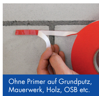
Ohne Primer auf Grundputz, Mauerwerk, Holz, OSB etc.