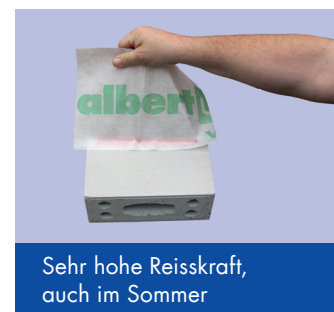
Sehr hohe Reisskraft, auch im Sommer