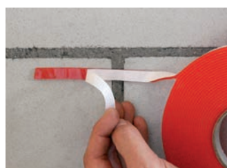
Sans primer sur crépi, briques, bois, OSB, etc.