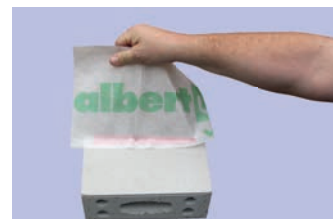
Très haute résistance à la traction, même en été