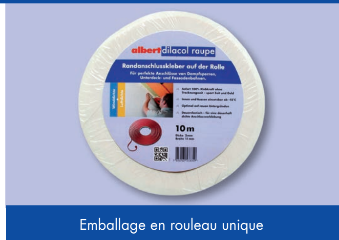
Emballage en rouleau unique