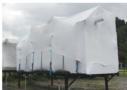
Feuille épaisse – protection optimale pour tous les temps.

Le comportement à la rétraction est biaxial – dans les deux dimensions. Ce qui vous donne un résultat parfait.